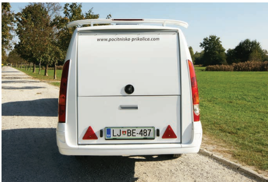
Na zadku so dvizna vrata, ki služijo kot zaščita pred vremenskimi vplivi, kadar je kuhinjski modul uporabi. Spojler na strehi naj bi dodal k udobju vožnje.