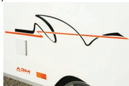
Grafika še poudarja dinamiko prikolice.