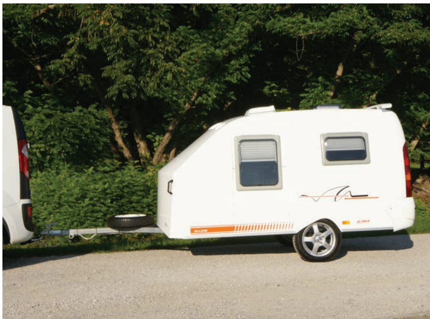
Atraktivna mini prikolica je dolga štiri metre in četr, od tega je bivalnega dela cele tri metre.

Mala prikolica, Kamniška 25, Ljubljana, T: 01 432 10 78, info@mala-prikolica.com, www.mala-prikolica.com